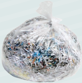
*Bagged shredded paper / Обрезки бумаги, упакованные в мешки