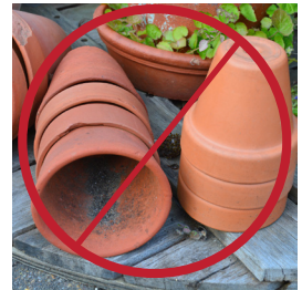
El abono NO debe usarse en un contenedor