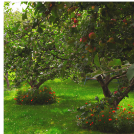
Trees and shrubs