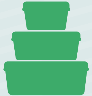
Recipientes de alimentos