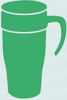
Tazas para bebedias calientes

Evita usar artículos que se desechan después de un solo uso. Conserva recursos y reduce la contaminación.