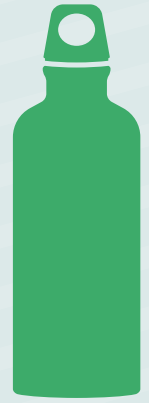
Botella de agua