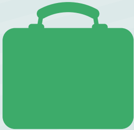
Bolsa de comida o lonchera