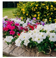
Ornamental landscaping Paisajes ornamentales 觀賞園林綠化