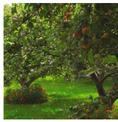
Trees and shrubs Árboles y arbustos 樹木和灌木