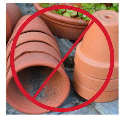
Compost should NOT be used in containers El abono NO debe usarse en un contenedor 不建議使用在花盆裡