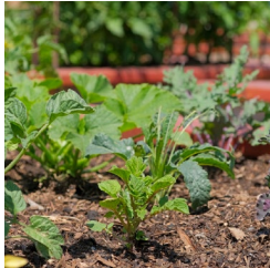
Vegetable gardens Huertas 菜園